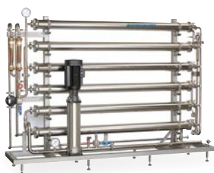
Система обратного осмоса выполнена из нержавеющей стали

Наши установки могут быть изготовлены по специальным пожеланиям заказчика. Все параметры и компоненты могут варьироваться в зависимости от требований. EUROWATER обладает колоссальным опытом производства трубопроводов,